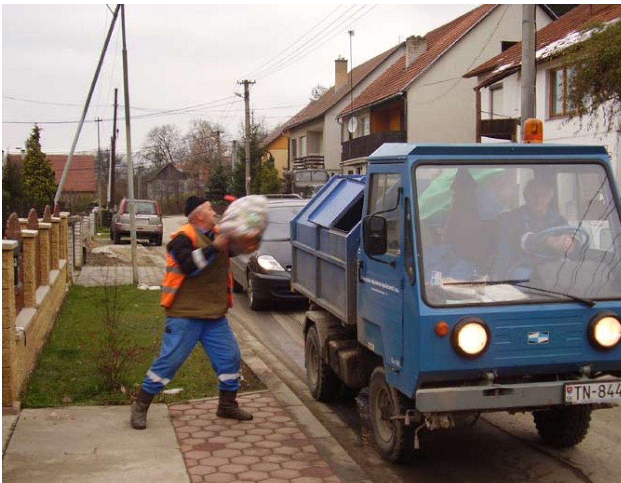
Dubnica nad Váhom – pytlový sběr