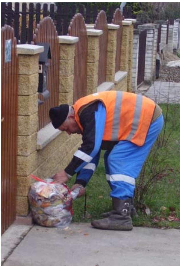
Dubnica nad Váhom – pytlový sběr

Stojí za zdůraznění, že úspěšné recyklační programy zavádí nejen v Rakousku, Německu, Švýcarsku, Holandsku nebo Skandinávii, nýbrž také na Slovensku. Česká republika zatím pokulhává.