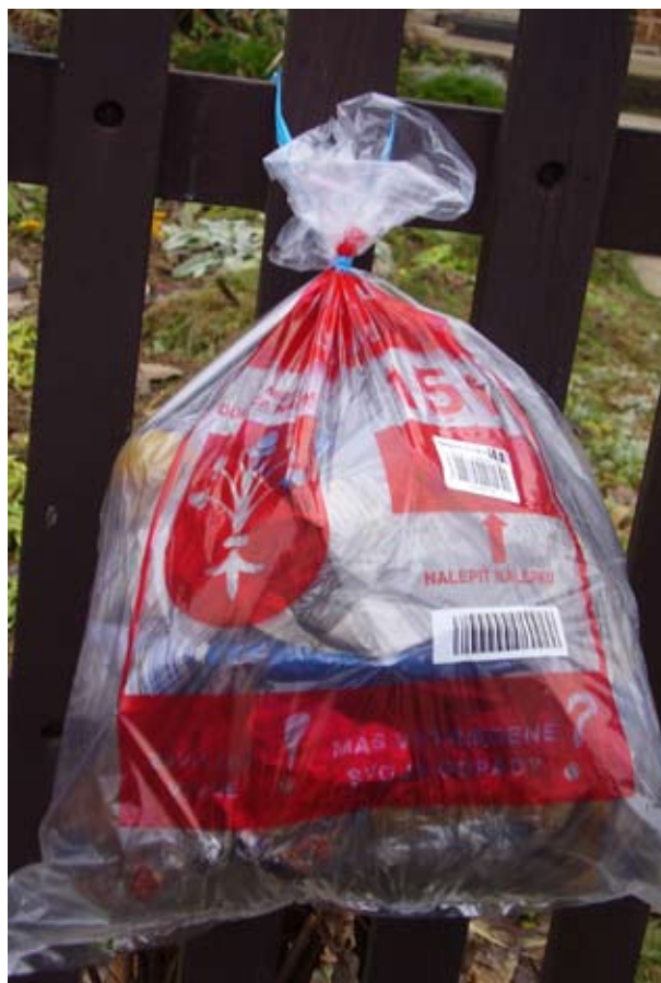
Dubnica nad Váhom – pytlový sběr