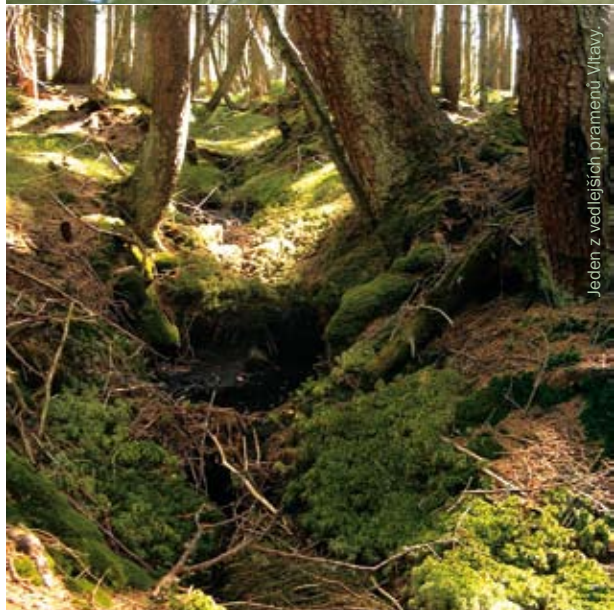
Jeden z vedlejších pramenů Vltavy